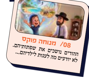
08 / מנוחה פוקס