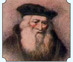
רבינו יעקב בעל הטורים דיע"א