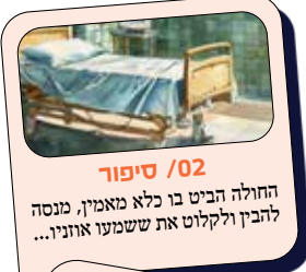
02 / סיפור

אבל הקטע המצחיק ביותר זה שֶׁה' טורח לשלוח לו מלאך כדי לעצור אותו, המלאך מתעלל בו - והוא בשלו. והשיא הוא שהאתון של בלעם רואה את המלאך והוא לא! ה"גאון הגדול" לא מבין את מה שאתון מבינה! וגם אחרי שהיא פותחת את הפה ומדברת איתו, הוא ממשיך להיות "נעול" על המטרה וממשיך בעקשנות לעבר הרצונות הרעים שלו, מה שמביא עליו רק ביוזנות ואת ההפך הגמור מרצונו, שהוא בעצמו מברך את ישראל בעל כורחו.