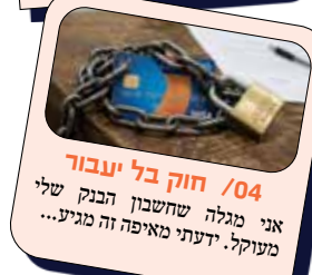
04 / חוק בל יעבור