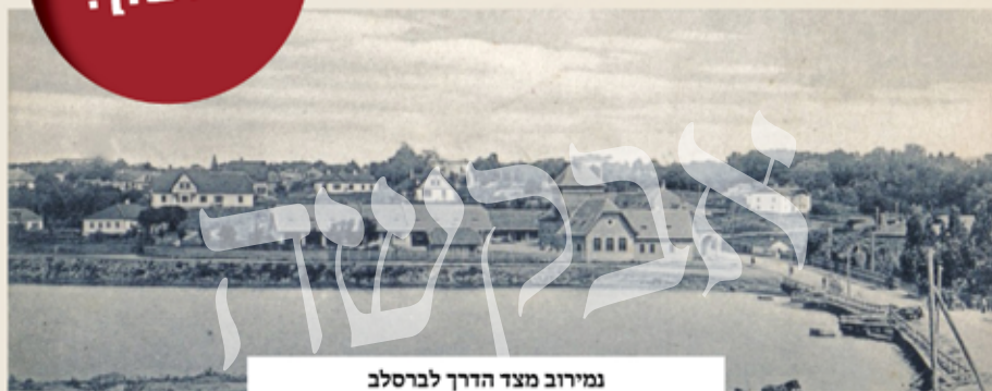
נמירוב מצד הדרך לברסלב

לאחר התפילה פתחו בשיחה עמו והוא שח להם כי זכה לשובות בברסלב אצל רבינו הקדוש רבי נחמן שהצית שלהבת קודש בנשמתו. עובדה זו עוררה אותם ודחקה בהם להזדרז ולנסוע שוב לרבינו, ולהתקרב אליו ביתר שאת ויתר עוז.