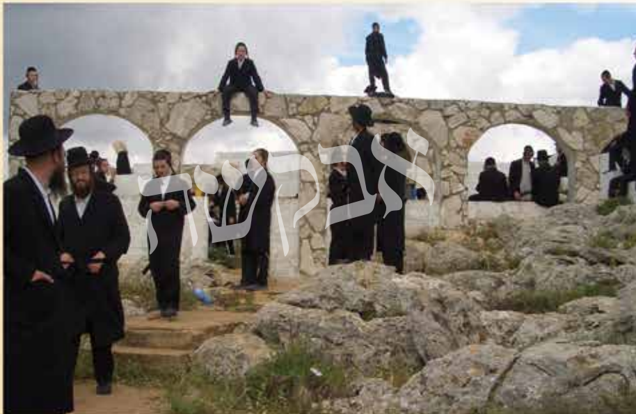
נסיעה מורשת הנחל תשרי ע"ז