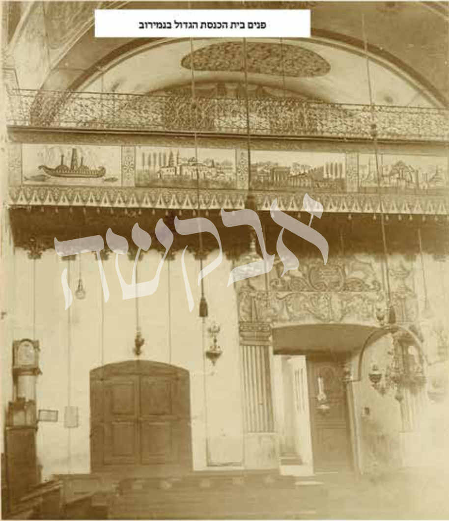
פנים בית הכנסת הגדול בנמירוב

גם בחג השבועות תקצ"ז נאספו בצל קורתו תלמידים נאמנים. ביום טוב קודש זה גילה מוהרנ"ת לעם סגולה את הלכה ה' מהלכות פדיון בכור, המיוסדת על התורה 'כי מרחמם ינהגם' (ליקוטי תנינא