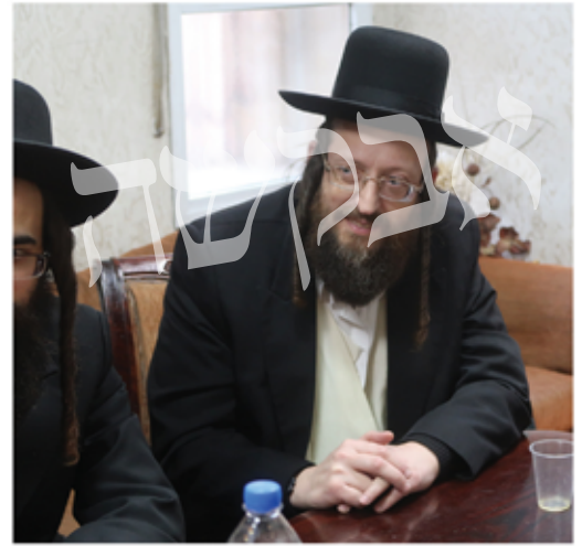
באסיפה עבור מורשת