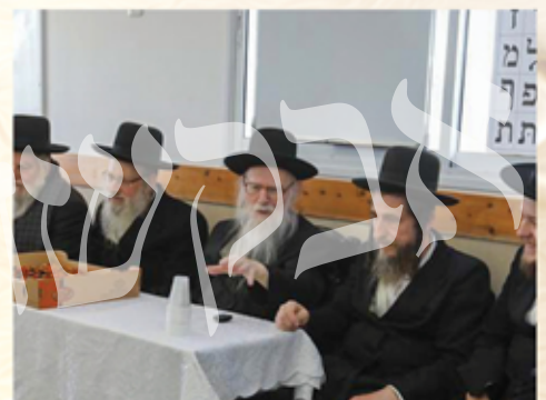
עם ילדי החמד בחגיגת החלאקה בת"ת צאן הנחל בית שמש

אחד מבניו סיפר לי, שבימיו האחרונים, ראהו קורא קריאת שמע, והמילה שעליה התעכב ביותר, הייתה המילה 'אמת'.