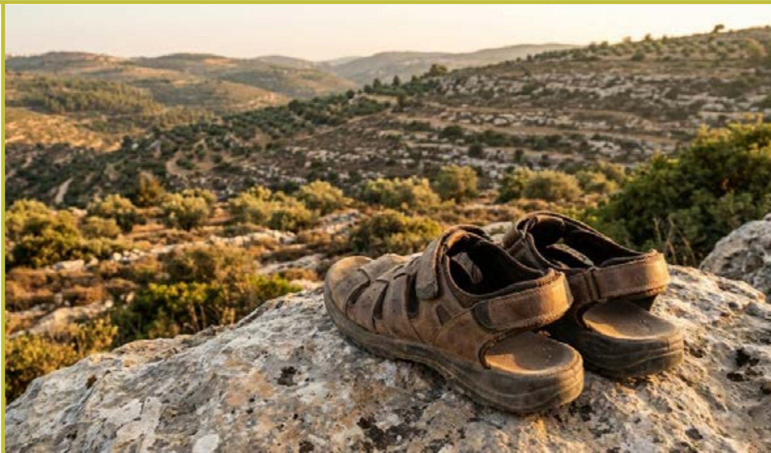
טיול במסילות הנפש הפנימיים של ההולכים עם התורה

זהו מסע מרתק של אברך צעיר שביקש להפוך את האורות - לכלים, ואת ההתלהבות - להקשבה עדינה לרמזים אותם רבינו שולח לו באופן אישי.