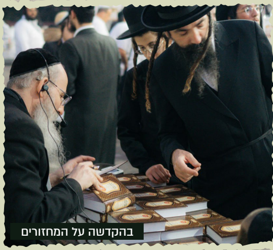
בהקדשה על המחזורים

אנו מקווים שהציבור יירתם בחפץ לב וייתן לנו את הכוחות להוציא את הרצונות הגדולים הללו הלכה למעשה.