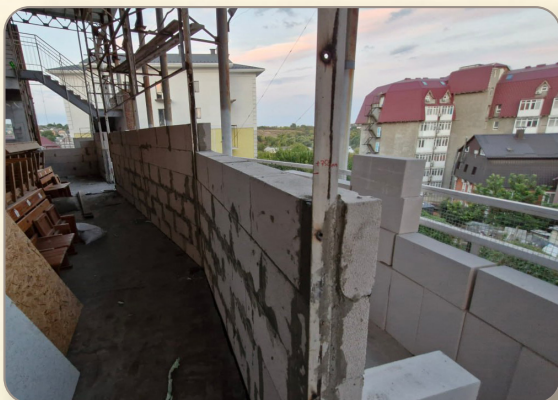
עבודת הבניה ערב ר"ה תשפ"ה