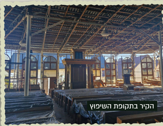
הקיר בתקופת השיפוץ