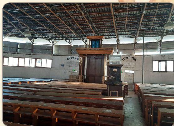
כותל המזרח הישן