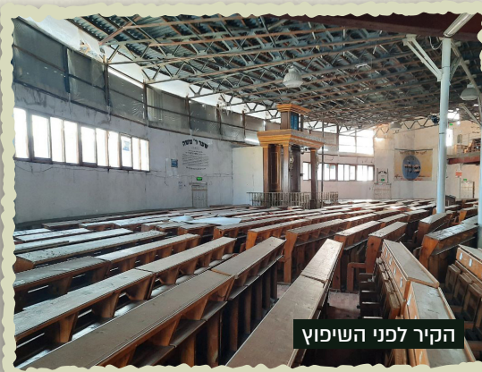
הקיר לפני השיפוץ

אנשי הפקה ותחזוקה, בעלות של אלפי דולרים. צריכים מערך של עובדי תחזוקה ונקיון בימי